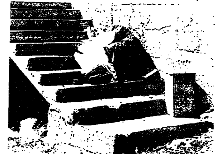
جنود إسرائيليين يتلقون اهدنتلامم من عينا الشعب أمس

وترجل منها اثنان يرتديان لباساً وأتيا من الرصاص ويصيان علم الأمم المتحدة ، واتجهوا نحو « تل الرجم » الذي يقع فيه مخفر الجيش اللبناني الذي هاجمته القوات الإسرائيلية واستشهد سبعة من عناصره . وبالعدسة المكبرة لاحظت ان عدداً من جنود العدو يتزايد ، في وقت كانت خلاله تسبح عبارات باللغة الإنكليزية بين رجال المراقبة والضباط الإسرائيليين . وقد استمر الحوار دقائق ، وبدأ الإسرائيليون يتحركون من مواقعهم ، ثم شاهدت العشرات منهم ينسحبون باتجاه جامع البلدة ، حوالي الساعة الأربعة . وبعد ما شاهدت أربعة من جنود العدو يحملون جثة قتييل ملفوفة بحسرام صوفي . ومضى ربع ساعة فظهرت خيالة أخرى عليها جثة قتييل آخر . وشاهدت بعد ذلك اثنين من جنود العدو معصوبي الرأس ، وعلسى ليلهما دماء . عملية الانتصاحات وبوصول جثتي القتييلين الإسرائيليين إلى قرب جامع البلدة ، سمعت أصوات طلقات رشاشة ، وأصوات بكرات الصوت من جديد ، كان العدو يجمع خسارته . وبعد الساعة الثالثة بعد الظهر ، بدأت أشاهد أعداداً كبيرة من الجنود الإسرائيليين تتدفق من القرية باتجاه الجامع ، ومن هناك بدأ الإسرائيليون بالانسحاب ، واستمرت عملية انسحابهم حتى الساعة الثالثة والنصف . وعندما خرج أهالي عيننا الشعب من منازلهم ، شاهدت إحدى القذائف وقد سقطت وسط حديقة في قلب البلدة ودولها أطفال . وعندما انتكست إلى مخفر الجيش في تل الرجم ، شاهدت الجريمة الوحشية التي ارتكبتها جنود العدو ضد أفراد المخفر الذين كانوا نياماً . وشاهدت جثتهم فوق ترابهم وعند باب الخيمة ، وقد مزقها الرصاص . وفي إحدى زوايا الخيمة كانت هناك جثتان لجنديين بلباس الترم .